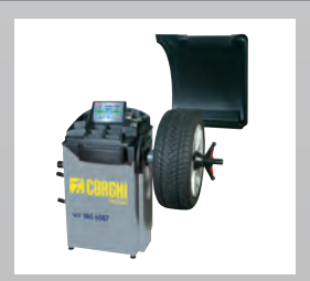
EM7240 - VAS 6587