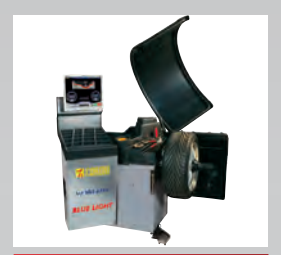
BLUE LIGHT - VAS 6589