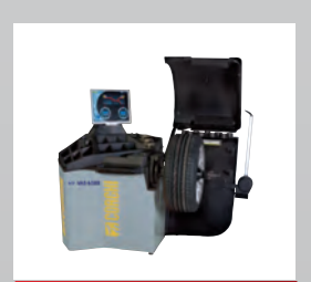
EM7470 - VAS 6588