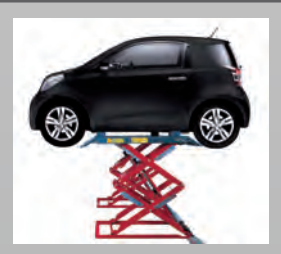
ERCO 301 TY