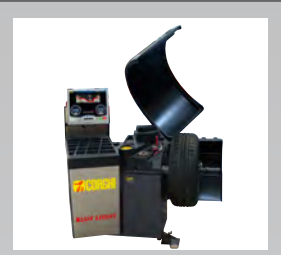
BLUE LIGHT - BMW