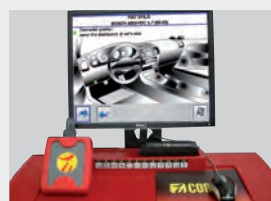
Tecnologia di assetto totale

sistema di calibrazione del sensore di rotazione volante integrato nell'assetto ruote.